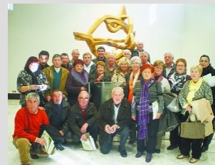
Agrupación Socialista de Rentería

Ya son varias las Agrupaciones Municipales del PSE-EE que han visitado la Cámara. Así han conocido de primera mano la labor parlamentaria, las respuestas que el Gobierno da a la oposición e intercambiar impresiones directamente con los miembros del grupo socialista que les representan en la cámara autonómica.